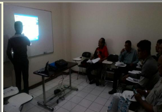
Training Product Motorcar, Liability, Money Assurance, April 2018, ACA Cabang Bekasi