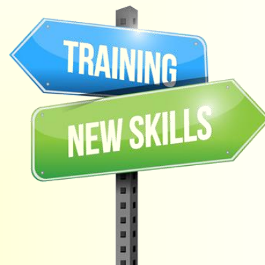
Training Benefit Mitraaca dan Product ACA Syariah dengan bapak Novel Ruspandi, Januari 2018, ACA Cabang Bekasi